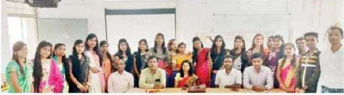
स्वागत समारोह में उपस्थित प्रोफेसर और छात्र.